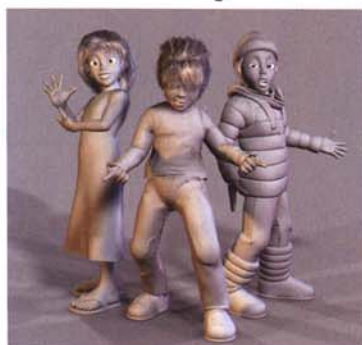
L4-Illustrationen: Gray Girls (I) und Booty (oben)