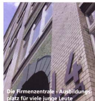
Die Firmenzentrale - Ausbildungsplatz für viele junge Leute